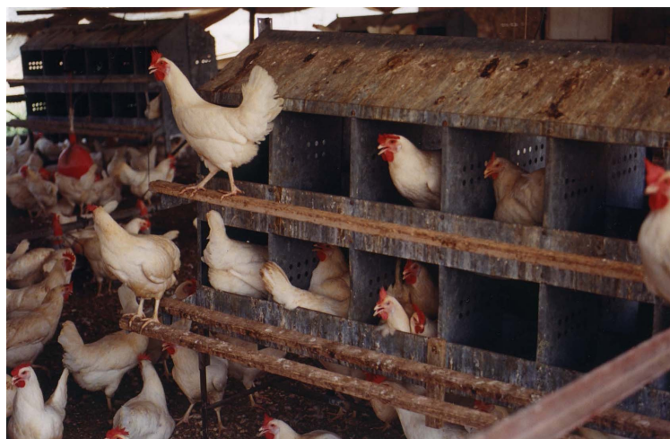
תיבות קינן בלול נטול כלובים במושב היוגב

הצורך בקינן הוא צורך מולד ורב עצמה. התרנגולת זקוקה למסתור מתאים ולחומרי קינן. מחקרים מדעיים מצאו שתרנגולות ישקיעו יותר מאמץ כדי להגיע למקום בו הן יכולות לקנן ממה שהן ישקיעו כדי להשיג מזון לאחר שעות ארוכות של הרעה 25 . בהעדר אפשרות לקנן, התרנגולת עושה תנועות קינן "על ריק" ותנועות סטריאוטיפיות ומשמיעה קולות מצוקה 26 . כאשר תרנגולת כזו משוחררת למקום שבו יש לה אפשרות להקים קן, היא ממהרת לעשות כן, ומפצה את עצמה על תקופת החסך בשהייה ממושכת בקן – הרבה מעבר לזו של תרנגולת שלא סבלה מחסכים 27 .