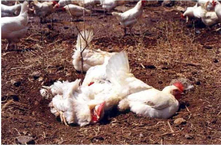
תרנגולות עושות אמבטיית חול בצוותא כלול-חצר במושב היוגב.

הסבל החריף שחוזה התרנגולות בכלוב, והצורך שלה במצע, נובעים גם מהדחף לבצע אמבטיות חול. כאשר יש לתרנגולות אפשרות לעשות זאת, היא יוצרת גומה בקרקע, מנפחת את נוצותיה, מתיזה עפר אל תוכן, מנערת אותן ומתגוללת מצד לצד בתוך העפר. אמבטיות החול הללו מאפשרות לתרנגולות לשמור על מבנה הנוצות