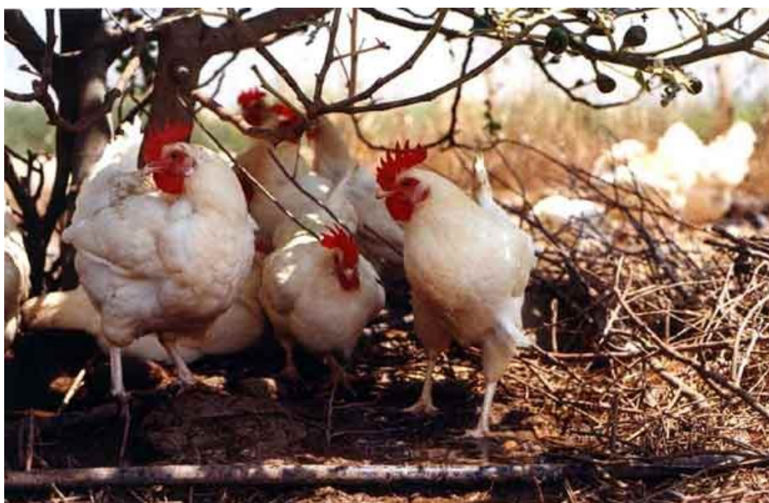
תרנגולות בלול נטול כלובים במושב היוגב.

תרנגולות בתנאי חצר מסוגלות לפעולות שאינן אפשריות בשום אופן גם בכלוב הגדול והמתוחכם ביותר. בכל הכלובים ישנן מגבלות אפילו בנוגע לתנועות כמו מתיחת ראש וצוואר, מתיחת רגליים ופרישת כנפיים. אף כלוב אינו מספק בצורה סבירה את הצרכים לקנן, לנוח על ענף, לעשות אמבטיית חול או לשוטט ולחטט בקרקע. בלולי-חצר, לעומת זאת, התרנגולת יכולה ללכת, לרוץ ולהתעופף. היא בוחרת תיבת קינון, מבטאת את כל מגוון ההתנהגויות הקשורות להטלה ושוהה בקן לצורך ההטלה ללא תחרות מתרנגולות אחרות. יש לה שפע של שטח ומצע כדי לבלות את זמנה בחקירת הסביבה, בשוטטות, בחיטוט ובניקור. היא עושה אמבטיות חול על כל דקדוקיהן בצוותא עם תרנגולות אחרות. יש לרשותה מדפי לינה מוגבהים כדי לנוח עליהם.