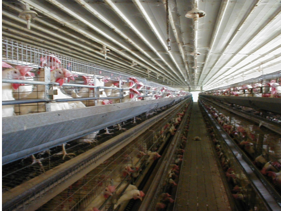
לול סוללה בגבעת חן

מרבית התרנגולות בתעשיית הביצים בישראל מוחזקות בכלובי מתכת חשופים. מספר תרנגולות דחוסות בכל כלוב. במקרה הטוב ביותר השטח המוקצה לכל תרנגולת הוא כשטח דף נייר משרדי (4A). לעתים מוקצה לכל תרנגולת רק כמחצית שטח זה. רצפת הכלוב עשויה רשת ומלוכסנת: