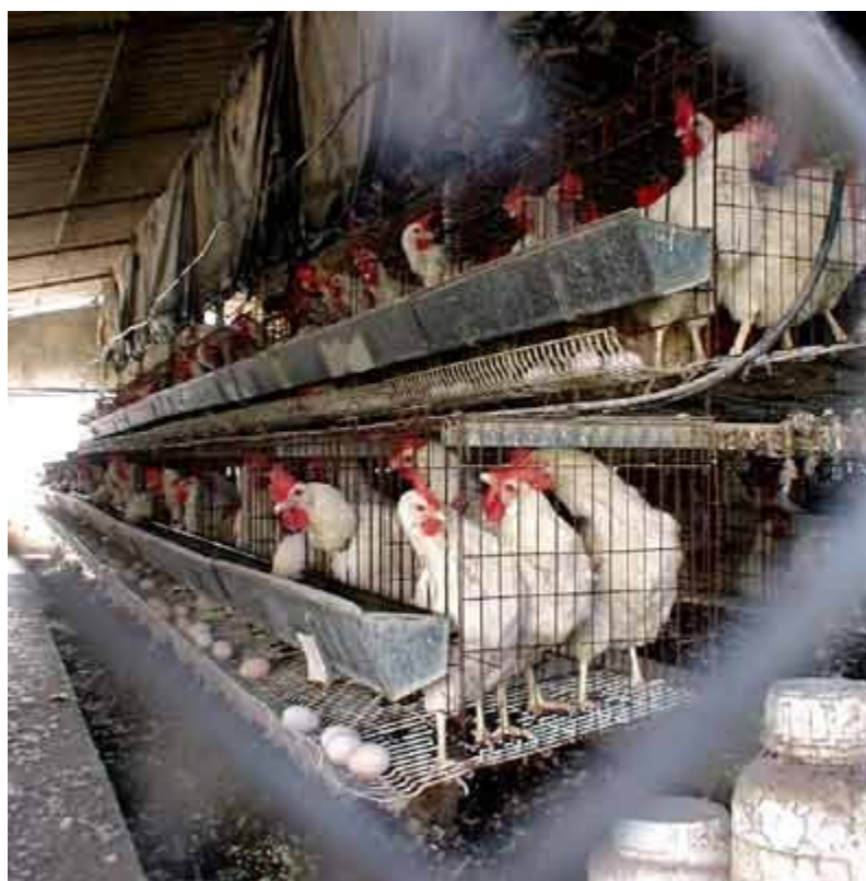
שיטה שאבד עליה הכלח: לול סוללה במושב כפר הנגיד.

התוצאה: מדיניות שבטווח הקצר תיתן סיוע כלכלי לזממים בעלי-הון, ושבטווח הארוך תוריד כספי ציבור לטמיון, ותשאיר את המשק הישראלי ואת נופי הגליל עם צלקות בלתי-הפיכות, של לולי כלובים ענקיים שהתיישנו ואבד עליהם הכלח.